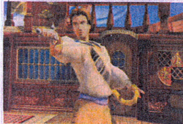
Piratenfigur im PC-Spiel . FOTO: MEYER

HAMBURG (ddp) Viele Menschen nutzen Computerspiele als Traumwelten, um in die Rolle eines muskelgestählten Helden oder einer bildhübschen Prinzessin zu schlüpfen. Eine Studie der Hamburg Media School hat jetzt ergeben, dass es stark von der eigenen Lebenszufriedenheit abhängt, für welche Spielfigur sich ein Nutzer entscheidet. In einem Experiment gestalteten Personen, die mit ihrem Leben zufrieden sind, solche Avatare, die ihnen relativ ähnlich sind. Die Spielfiguren von unzufriedenen Spielern wiesen hingegen deutlich weniger Ähnlichkeit mit den Persönlichkeitsmerkmalen ihrer Erschaffer auf, wie die Hochschule mitteilt.