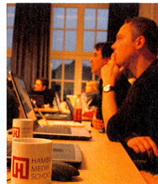
Konzentriert Die Journalistik-Schüler an der Hamburg Media School.

Die Bewerbungsfrist läuft bis zum 30 April ( www.hamburgmediaschool.com/nachwuchsinitiative ). Die Teilnahme ist kostenfrei, gefragt sind lediglich Begeisterung und Leistungsbereitschaft.